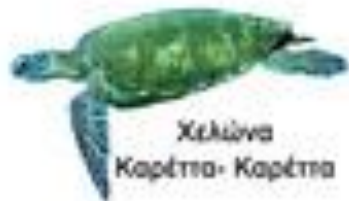
Χελώνα Καρέττα- Καρέττα